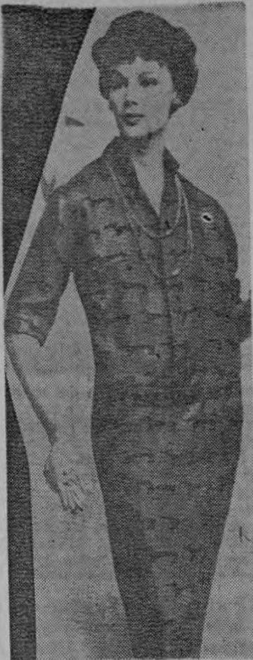
Vestido saco con estampados en negro sobre fondo carmelita claro. Se acompaña de un jacket con cierre invisible y terminado por un cintillo de la misma tela. Original de Sydney Wragge.

Mantillas francesas y españolas, Pañuelos suizos, Blusas, enaguas, Cancanes, Ropa interior K A Y S E R, Brassiers y Fajas, Form-fit. Sweaters, estolas, pañuelos de lana, Medias, Carteras y billeteras Vanidosas, Joyería de fantasía, Flores para vestidos.